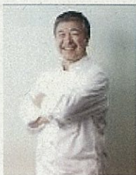
落合 務 氏