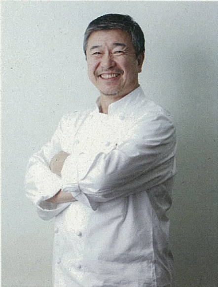
落合 務 氏

日本を代表する料理人にしてナゴヤ セントラルガーデンに店舗を構える、落合務氏、陳建太郎氏、笠原将弘氏が、休日のランチをテーマに親子でできる料理のデモンストレーションを開催します。 （入場無料）