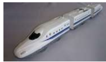
プラレール N700X77 編成 (2,700円)