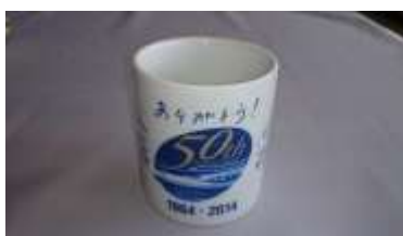
マグカップ50周年(1,296円)