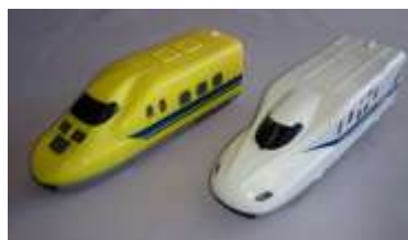
走る止まる光る新幹線 N700A(右) (1,890円) 走る止まる光る新幹線 923形(左) (1,890円)