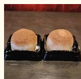
【エールカフェ】 トバイチョコレート