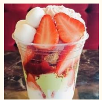
【エールカフェ】 桜と苺、抹茶のパフェ