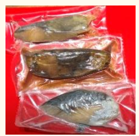
【賛否両論 名古屋】 煮魚3種セット