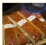
【エールカフェ】 桜と抹茶、大納言の パウンドケーキ