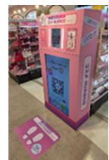
ARバーチャルメイク

売場に設置してある専用タブレットの画面に自身の顔を映し、気になる商品の色味や質感のシミュレーションができるサービス「ARバーチャルメイク」を導入します。お客さまが気になるベースメイクやアイメイク、リップなどの商品をタッチアップせずに様々なブランドを同時にお試しいただけ、気軽に商品を選定できます。