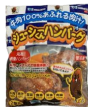
すぎもとミート ジューシーくんハンバーグ