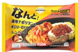
トップバリュ ベストプライス ガッツリ飯シリーズ