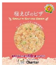
シャンテ 駿河産桜えびのピザ