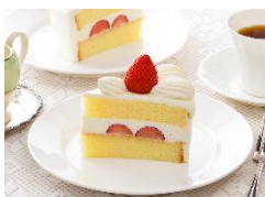
銀座コーギーコーナー

銘店コーナーでは、「銀座コーギーコーナー」のケーキをはじめ、「ユーハイム」「ありあけ」など全国の有名ブランドから、「田子の月」（富士市）や「長坂養蜂場」（浜松市）、「たこ満」（菊川市）、「ヤタロー」（浜松市）などの地元ブランドまで34のブランドを展開します。