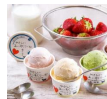
サンオーネスト やさしいあいすくりーむ