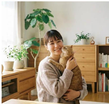
※ペットと暮らす生活イメージ