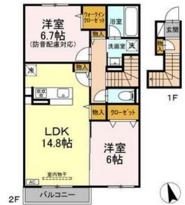
※間取り図 (202 号室の一例)