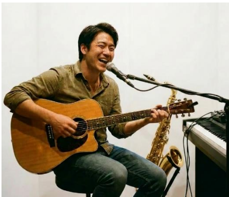
※楽器演奏など音を伴う趣味の利用イメージ

防音・ペット・ZEH の 3 要素を同時に備えた賃貸住宅は希少であり、「Avance (アヴァンセ)」シリーズにおいても新たな取り組みとなります。